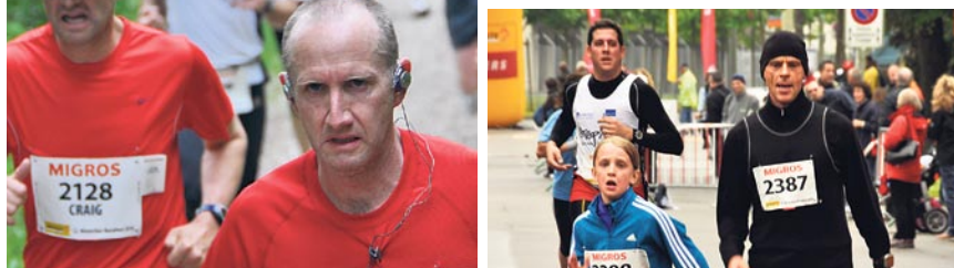
Jung und Älter erfreuten sich an idealen Laufverhältnissen.