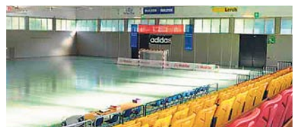
Die Eulachhalle bleibt leer.

Winterthur: Nach drei Austragungen scheint das internationale Pfingst-Handballturnier um die Winterthur-Trophy Geschichte zu sein. Grund für die kurzfristige Absage ist laut Organisatoren ein starker Anmelderückgang. gs.