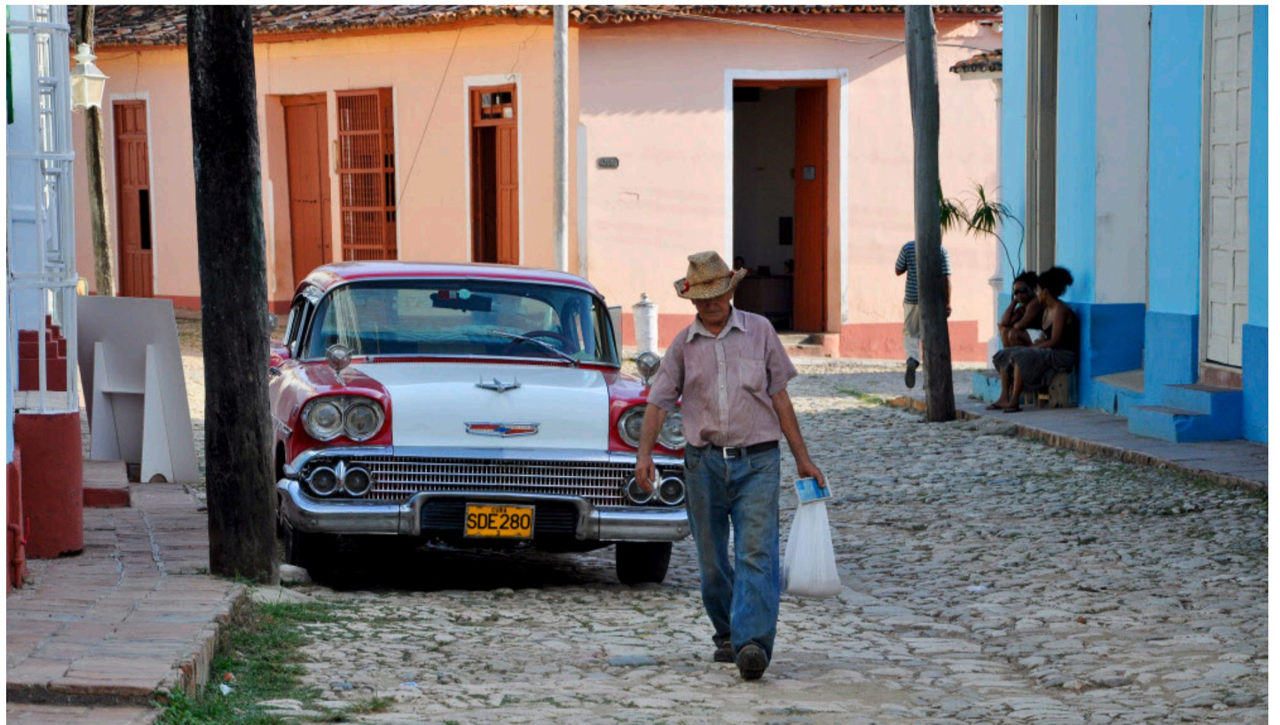
Gang auf dem Kopfsteinpflaster: In der Kolonialstadt Trinidad fühlt man sich in die Zeit der Zuckerbarone zurückversetzt.

Auf der Insel fehlt es an vielem, was der mit Luxus verwöhnte Tourist erwartet. Die Schaufenster von Supermärkten sind meist gespenstisch leer, und es kann auch schon mal vorkommen, dass im ganzen Land kein Brot mehr erhältlich ist. In Kuba muss man seine kulinarischen Ansprüche