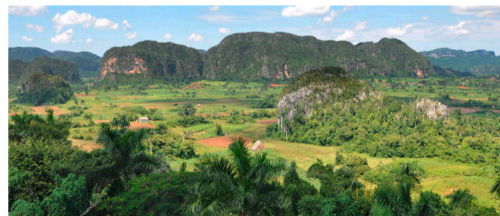
Beliebt bei Kletterern: Das Viñales-Tal.