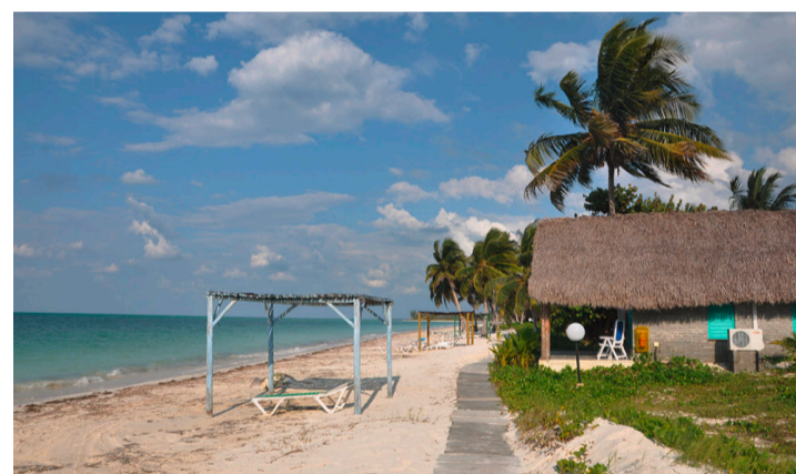
Eine Insel, ein Hotel: Erholsame Einsamkeit auf Cayo Levisa.