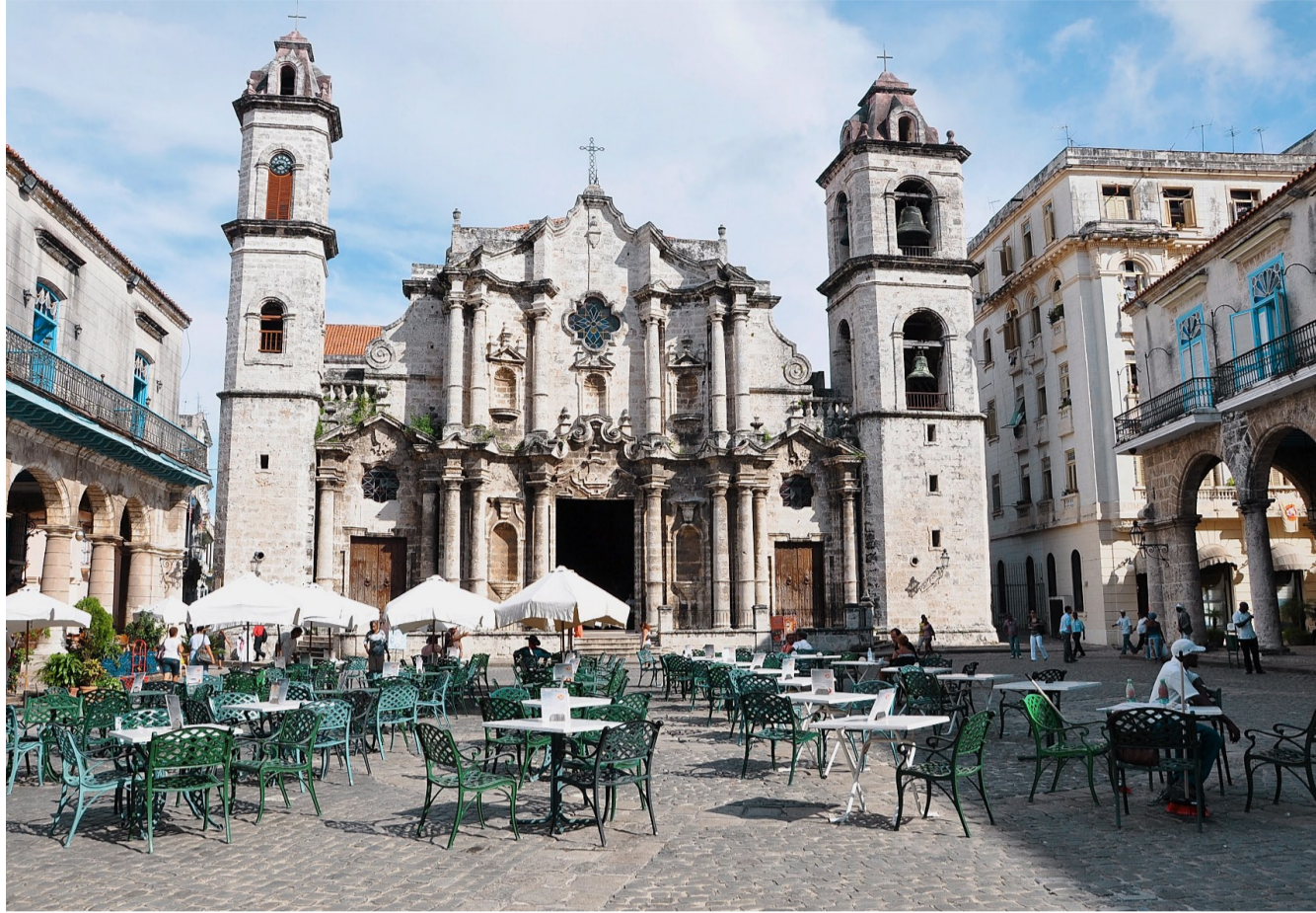
Kathedrale San Cristobal in Havanna.